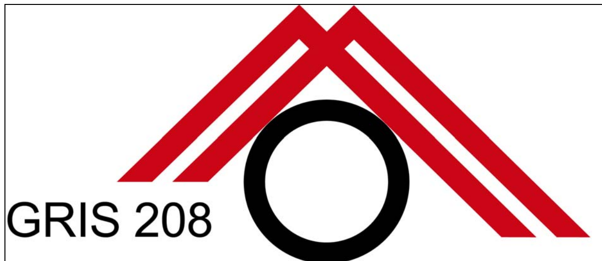
Abbildung 2: vereinfachtes GRIS Gütezeichen (Muster 1)