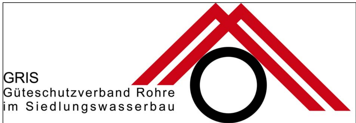
Abbildung 1: GRIS-Verbandsmarke